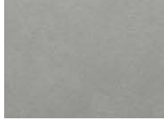
オボロミドルグレー 2023年10月発売