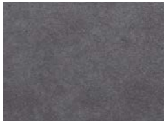
オボロチャコール