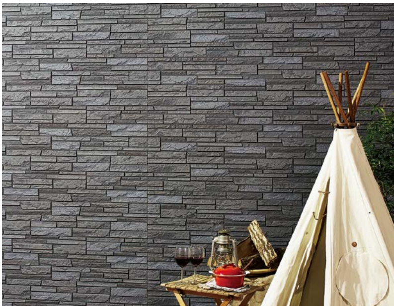
ガーディナル（AT-WALL18VZ）シリーズ「ノエガVZ」の施工例（色：ノエガチャコールF）

「ガーディナル」シリーズは、本体の三辺を合じゃくり加工し、専用のジョイント部材「カンシキくん」と合わせて施工することで、シーリングレス工法を実現した人気のサイディングです。本体表面に汚れが落ちやすくなるセルフクリーニング機能※2付きの塗料「セルフ素コート・EXE」を採用し、さらに業界最長の「塗膜20年保証」を実現したことにより、長年にわたって住まいの外壁を美しく保つことができます。