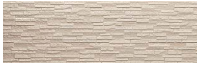
ヴェリエホワイトP