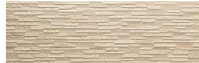
ヴェリエアイボリーP