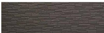
ヴェリエチャコールP