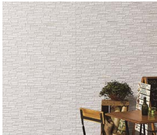
ガーディナル Smart AT-WALL15PZ シリーズ「ヴェリエ PZ」の施工例（色：ヴェリエライトグレーP）

「ガーディナル Smart」は、旭トステム外装が独自に開発した“新四辺合じゃくり工法”を採用し、外壁をスッキリと美しく仕上げる窯業系外装材シリーズです。セルフクリーニング機能 ※2 と防藻・防カビ機能 ※3 をあわせ持った「セルフフッ素コート・PLUS」を採用し、「塗膜15年保証」に対応しています。