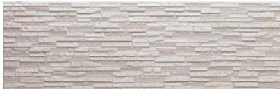
ヴェリエライトグレーP